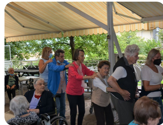
Zum Takt der altbekannten Schlager tanzen wir über die Terrasse