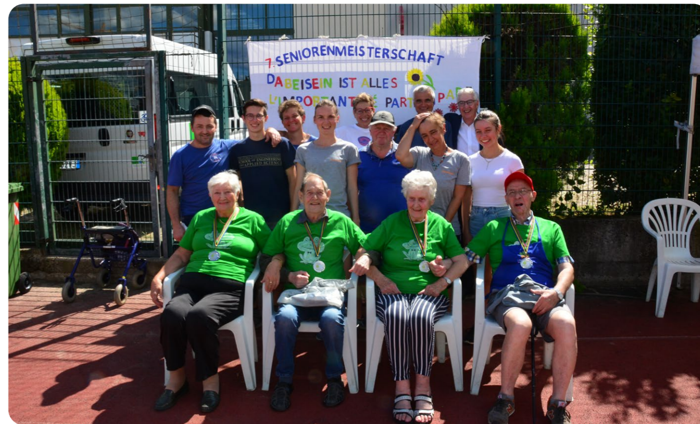
Gleich gehts los: Seniorenmeisterschaft in Eppan am 27. August 2021