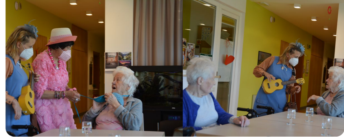
Die Clowns von Comedicus sind uns ans Herz gewachsen: Bei all ihren Besuchen bringen sie Heiterkeit und Frohsinn mit!