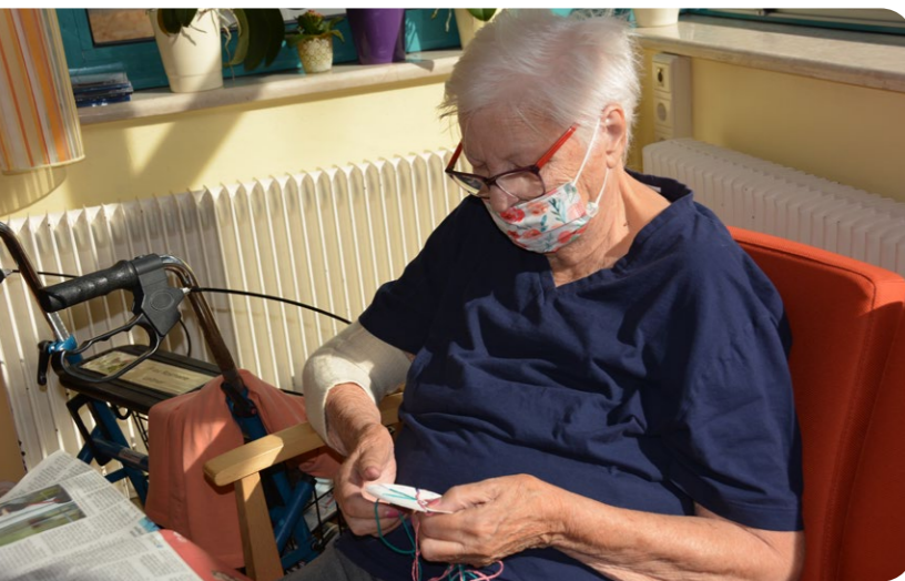
Ein angenehm-entspannender Zeitvertreib ist das Armbandknüpfen