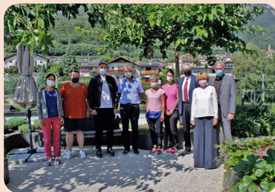
Con Waltraud Deeg sulla terrazza del 3° piano

La mattina del 2 settembre 2021 la signora Waltraud Deeg, membro della giunta provinciale altoatesina, è venuta a trovarci. All'entrata ha avuto l'occasione di conoscere il nuovo sistema di prenotazione visite e di accesso con il GreenPass, l'App PrenotaSemplice, che è in uso da qualche mese. Dopodiché ha salutato gli ospiti ed è salita insieme ai rappresentanti del comune e i responsabili della nostra casa di riposo al 3° piano, dove aveva luogo uno scambio sul nostro lavoro in tempi di pandemia e su diversi progetti futuri.