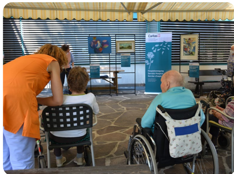
Bei der Übergabe der Kunstwerke im Juni 2021