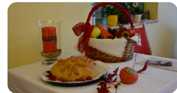
Gelernt ist gelernt: Bäckermeister Sigi backt das Brot für die Erntedankfeier