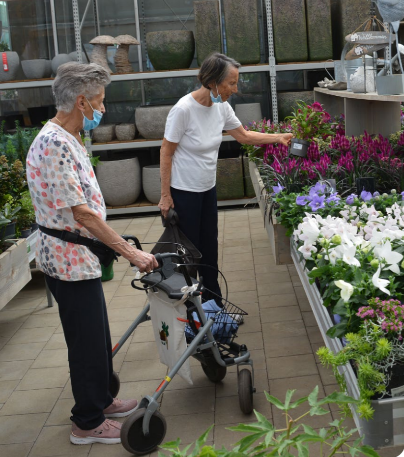
Einer unserer Sommerausflüge führte uns in die Gärtnerei zum Schauen, Stöbern und Staunen