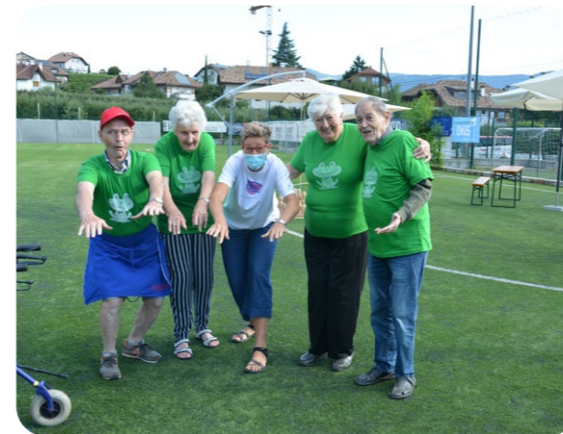
Die ganze Kalterer-Truppe hatte einen Riesenspaß bei dieser sportlichen Veranstaltung