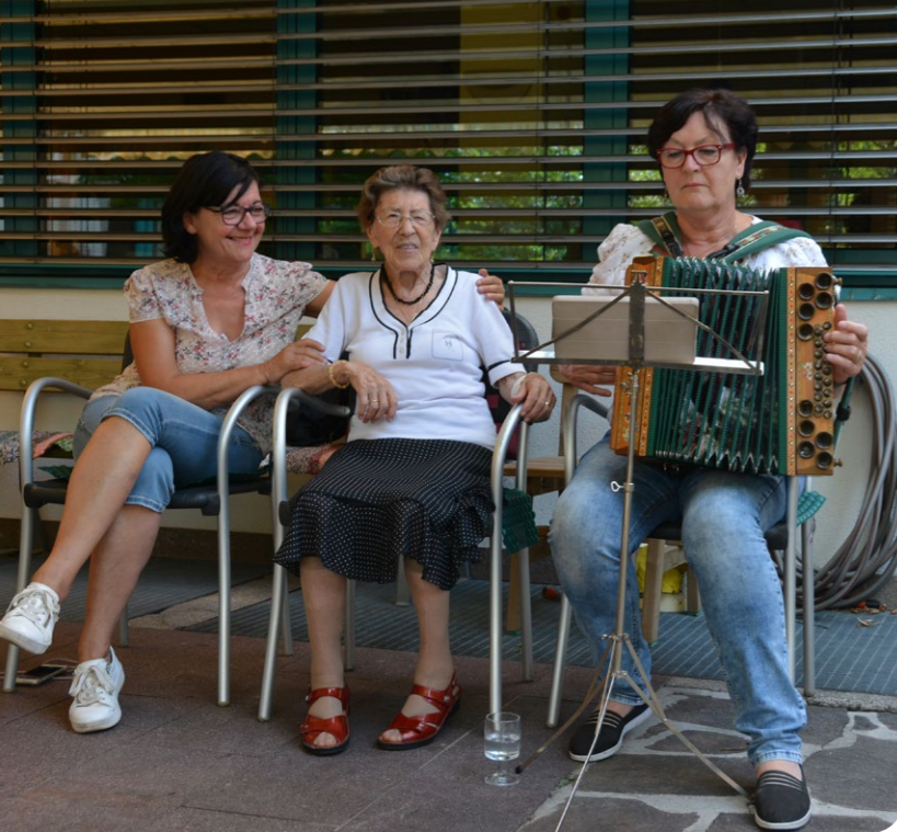
Besuch von Freunden ist immer schön – umso mehr, wenn sie Musik mitbringen!