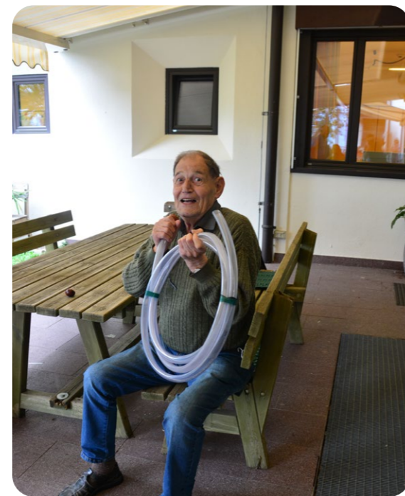
Wir dürfen auch mal probieren – aber so leicht ist das gar nicht!