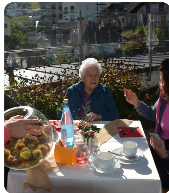
Schätzspiel beim Törggelen: Wie viele Kastanienigel sind wohl in dem Glas?