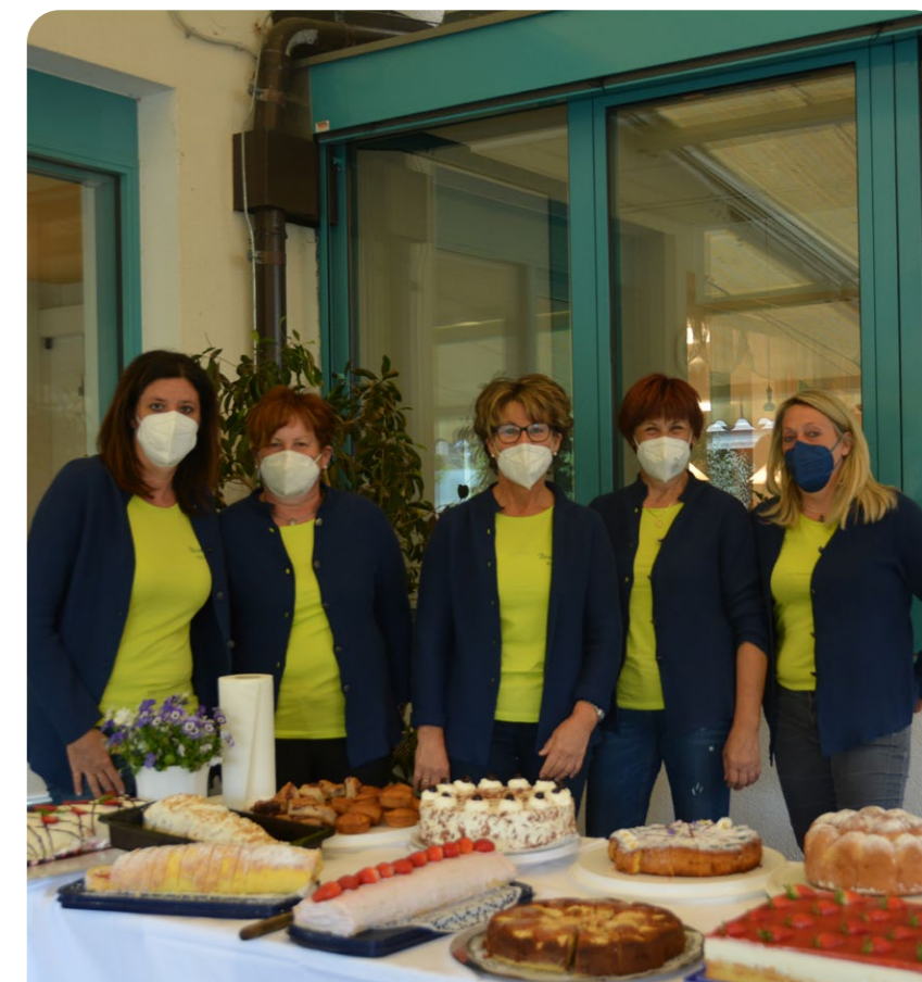
Ein Kuchenbuffet, ein Meer aus Blumen und viele freundliche Worte bringen die Kalterer Bäuerinnen an jedem Muttertag zu uns ins Haus