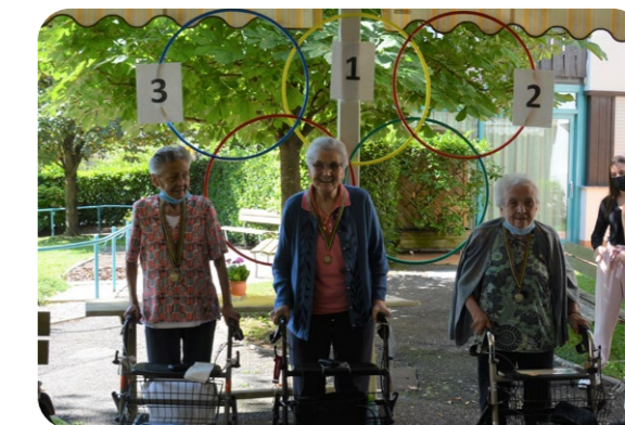
Die stolzen Siegerinnen ihrer Kategorie bei der diesjährigen Ausgabe der Heimolympiade