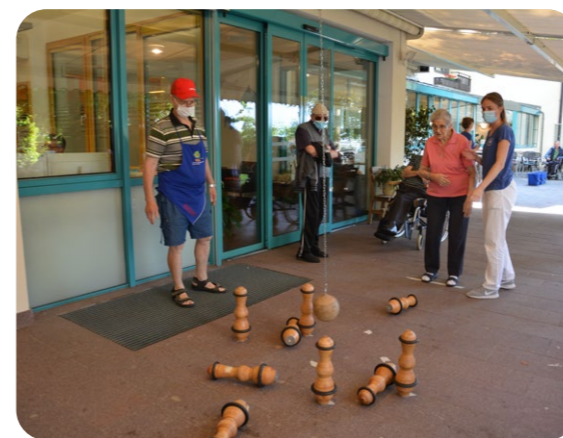
Schnelligkeit und Geschick ist in allen Disziplinen gefragt – und natürlich Gemeinschaftssinn, denn zusammen geht vieles leichter!