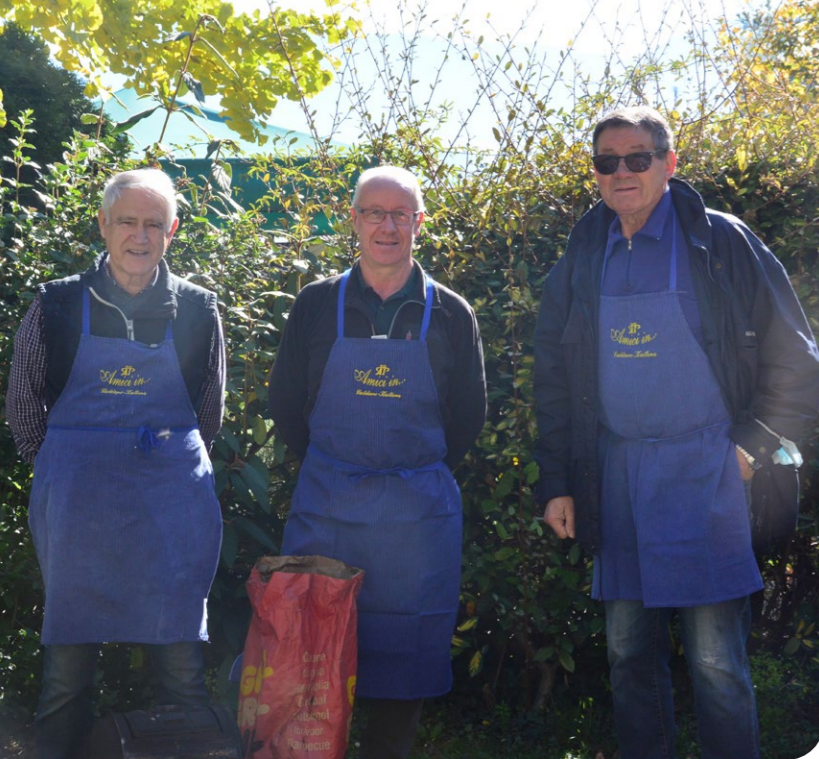
Grazie di cuore agli "Amici in..."!