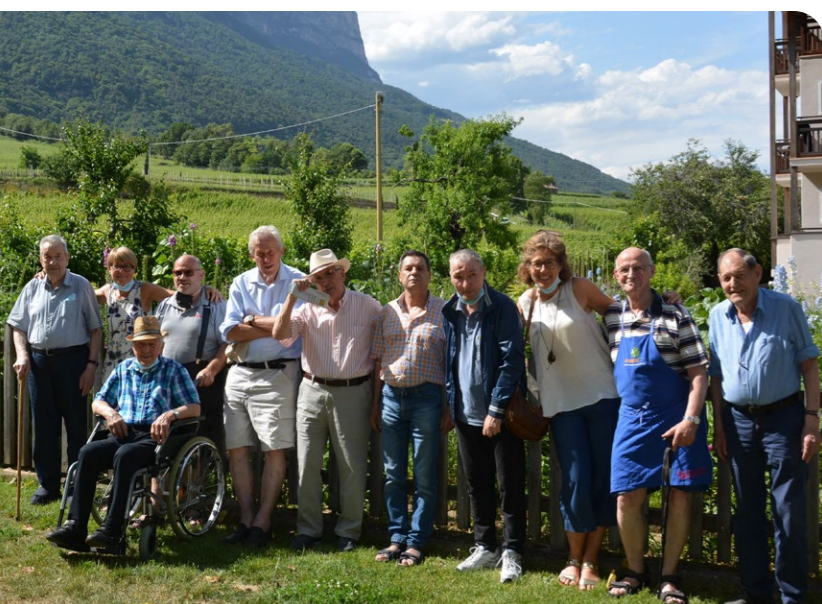
Das Ziel des diesjährigen Männerausfluges war der Stroblhof in Eppan