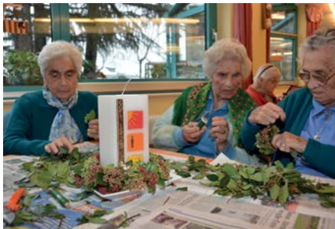
Ein Geschenk für den Bischof: gemeinsam gestalten die Heimbewohnerinnen eine Kerze, die sie Bischof Ivo Muser bei seinem Besuch im Januar überreichen wollen