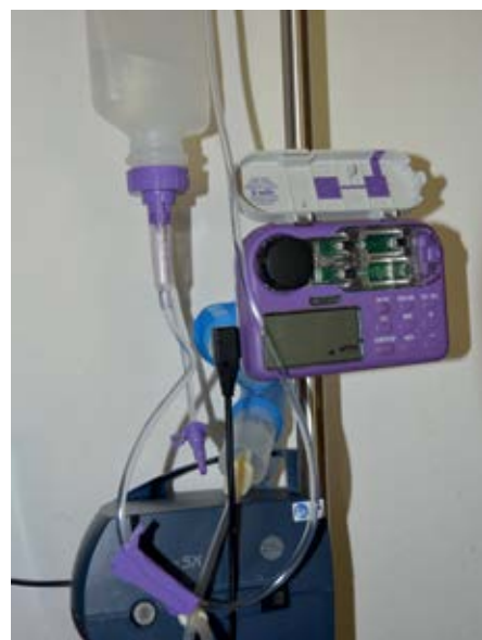
Technische Hilfsmittel erleichtern die Pflege eines Wachkomapatienten.

Für viele Angehörige ist die Situation sehr belastend und nur schwer zu ertragen. Viele engagieren sich in der Hoffnung, ihre Lieben wieder aufzuwecken. Sie streicheln sie, sprechen mit ihnen über gemeinsam Erlebtes, lesen ihnen aus ihren Lieblingsbüchern vor, richten das Zimmer wohnlich mit Erinnerungsstücken ein. Denn das zerstörte Gewebe im Gehirn kann sich besser erholen und erneuern, wenn der Patient auf allen Sinneskanälen Anregungen von außen bekommt. Wir können beobachten, dass diese Patienten immer wieder neue Muster entwickeln, da das Gehirn neue Vernetzungen ermöglicht.