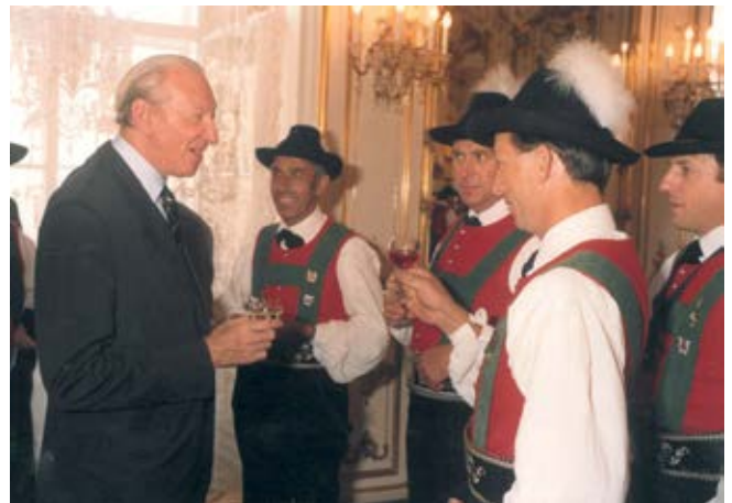
Eine Gruppe von Musikanten zu Besuch beim österreichischen Bundespräsidenten Dr. Kurt Waldheim 1990

Es hat sich viel verändert seit meinen Anfängen bei der Musikkapelle. Die erste Frau haben wir 1984 aufgenommen, die zweite zwei Jahre später. Heute sind zwei Drittel der Mitglieder Frauen und das klappt sehr gut. Ich erinnere mich, dass man uns vor vielen Jahren bei einem Kurs geraten hatte,