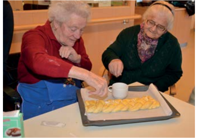
... noch ein paar letzte Handgriffe zum Verfeinern und dann ab in den Ofen mit dem Hefezopf!