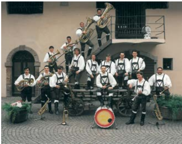
„die Böhmische 1996“

zum Bersten voll, die Leute sind sogar vor der Tür gestanden und wir haben die Fenster ge-