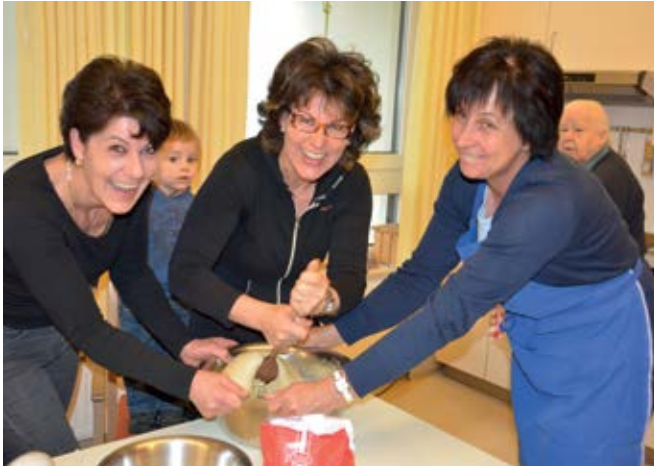
Die Kalterer Bäuerinnen zeigen ihre Backkünste. Mit vereinten Kräften wird der Teig sicher besonders locker...