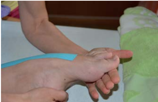
Häufig finden sich Spastiken an den Extremitäten die intensive manuelle Therapie erfordern

Die bürokratischen Hürden für eine erneute Aufnahme in Rehastrukturen sind oft unüberwindbar und die fachspezifische Ausbildung unsererseits und die geeigneten Strukturen mangelhaft .