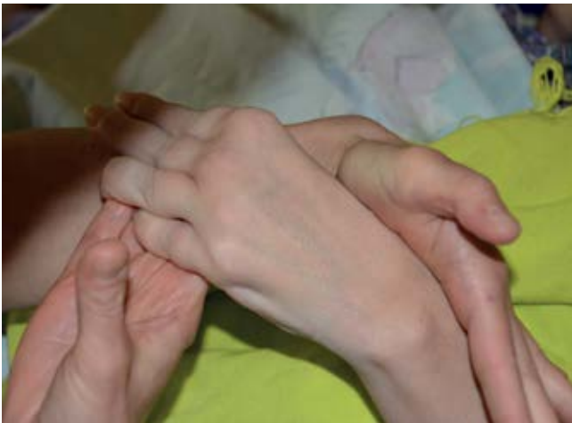
Sanfter Umgang bei Körperpflege fördert das Vertrauen zwischen Pfleger und Patient

Jährlich fallen etwa 3.000 Menschen ins Wachkoma. Auslöser sind Unfälle mit Hirnverletzungen, eine Hirnblutung durch ein geplatztes Gefäß oder ein Herzstillstand mit längerer Sauerstoffunterversorgung des Gehirns. Es kommt zu einem Bewusstseinsver-